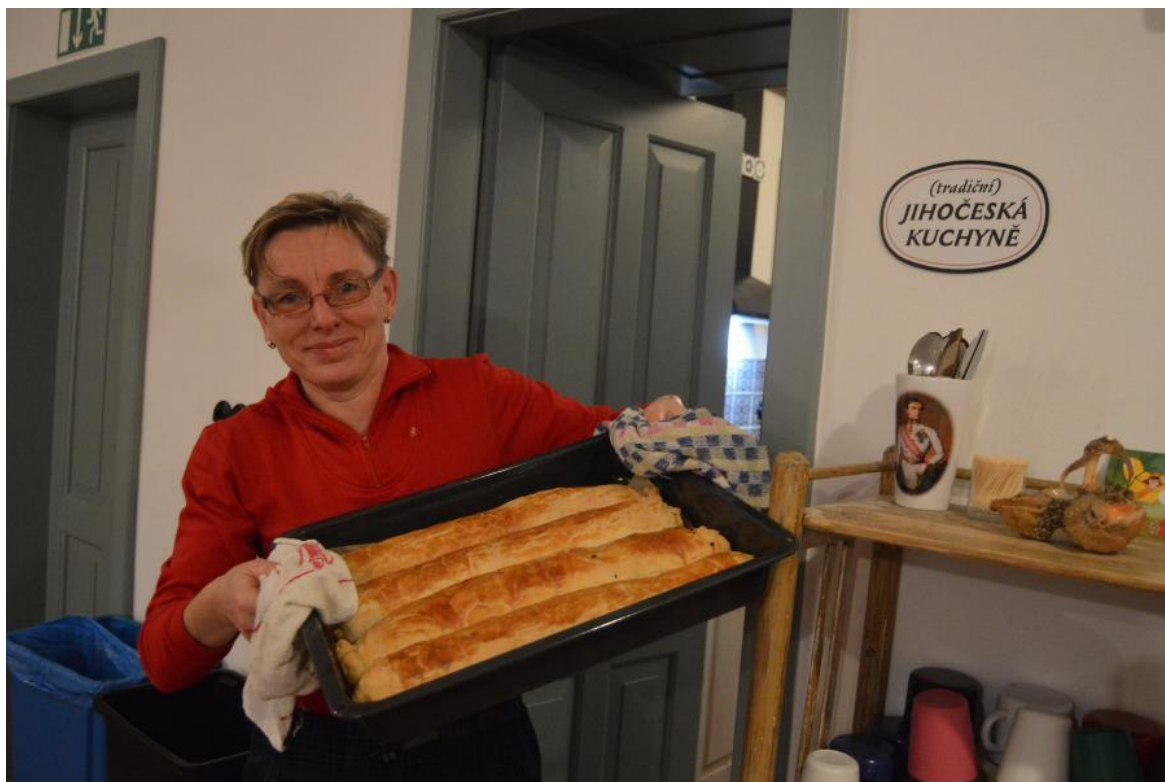
Pololetky na sněhu a hoodně štrúdlů