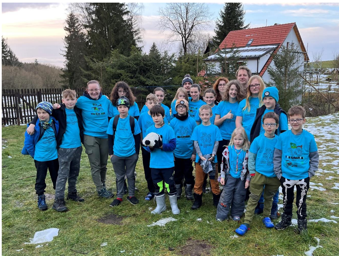
Společná fotka z Ražniči 2022

První otázkou bude, kolikáté přibližně číslo TOMíku v březnu 2023 za celou éru oddílu vyšlo?